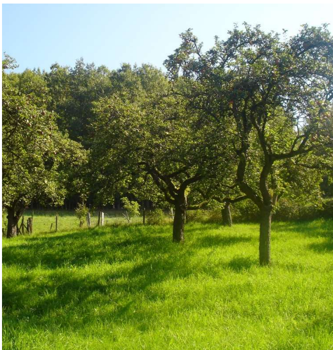
Obstwiese im Sommer

Samstag, den 06. Juli 2024 Gebroth (Hunsrück)